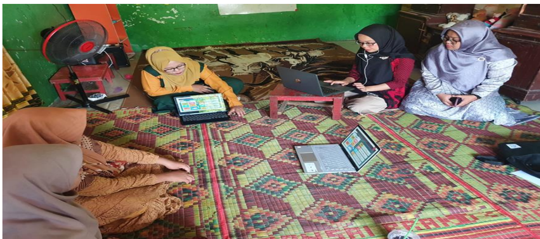
Gambar 1 Tim Menjelaskan Materi Pelatihan

Kegiatan PKM ini diawali dengan pemaparan materi dari salah seorang TIM PKM. Materi yang disampaikan diawali dengan cara menampilkan aplikasi kipin school yang sebelumnya telah di download di laptop sekolah. Berikut tampilan layar aplikasi kipin school.