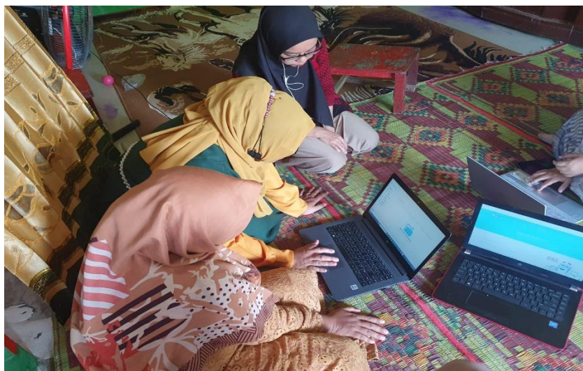
Gambar 4 Praktik Penggunaan Kipin School

Pada gambar 3 ini terlihat fitur-fitur yang dapat digunakan oleh guru PAUD saat proses belajar mengajar. Diantara fitur-fitur yang dapat dimanfaatkan diantaranya buku aktivitas, buku menggambar/mewarnai, video, dan cerita boneka. Berikut ini beberapa guru yang mencoba beberapa fitur prasekolah.