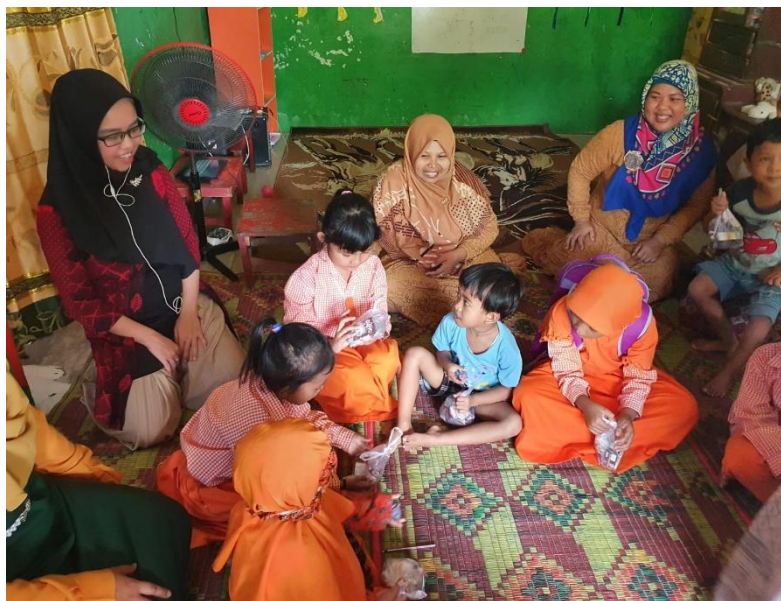
Gambar 6 Murid terkesan dengan Aplikasi Kipin School

Gambar 5 ini terlihat beberapa murid dan guru praktik langsung menerangkan video anak yang sedang diputar. Guru menjelaskan kepada anak cerita video ini tentang apa dan juga menjelaskan kepada murid nilai positif yang ada dalam video tersebut.