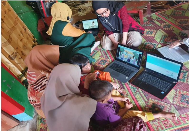
Gambar 5 Murid Antusias saat menonton Video dari Kipin School

Gambar 5 ini terlihat beberapa murid dan guru praktik langsung menerangkan video anak yang sedang diputar. Guru menjelaskan kepada anak cerita video ini tentang apa dan juga menjelaskan kepada murid nilai positif yang ada dalam video tersebut.