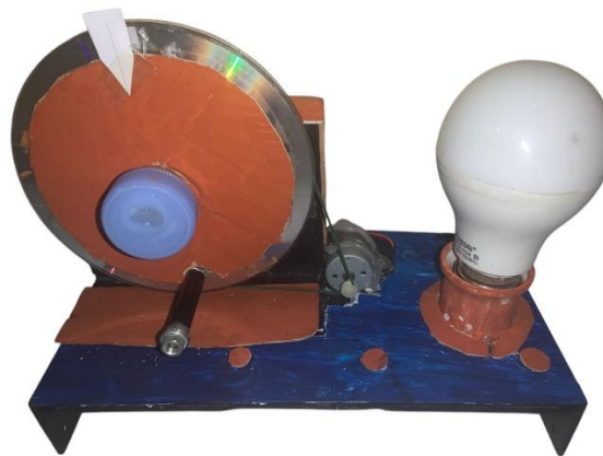
Gambar 1. Media Edukasi Konversi Energi Menggunakan Generator Mini DC, Piringan, Pemutar dan Lampu LED Sebagai Beban Cahaya (Sumber : Dokumentasi Peneliti, 2025)

Penelitian ini menghasilkan media pembelajaran konversi energi berbasis generator mini yang terintegrasi dengan perangkat digital untuk menampilkan data tegangan, arus, daya, dan intensitas cahaya secara real-time. Media dirancang agar peserta didik dapat mengamati proses konversi energi secara langsung melalui tampilan pengukuran digital, sebagaimana direkomendasikan dalam pembelajaran fisika modern berbasis teknologi (Fauzi & Saefudin, 2021; Suryani et al., 2021). Secara fisik, media terdiri atas rotor dari piringan CD, sabuk karet, motor DC yang berfungsi sebagai generator, serta LED sebagai beban. Pengukuran tegangan dan arus dilakukan menggunakan multimeter digital, sedangkan intensitas cahaya diukur menggunakan aplikasi Light Meter , sesuai praktik pembelajaran berbasis eksperimen digital yang telah digunakan dalam penelitian sebelumnya (Suryani et al., 2020).